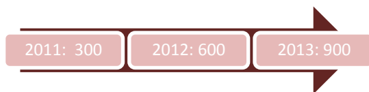
fig. 1 Deelnemende kerken Micha Zondag gebaseerd op aantal unieke downloads kerkenpakket

Het kerkenpakket was compleet en op tijd. Het is weer meer gedownload dan voorgaande jaren – wat naar we mogen aannemen betekent dat het ook door meer kerken is gebruikt. Unieke aan dit materiaal is, dat het zelfs in de maanden na de Micha Zondag nog enkele tientallen malen per week wordt gedownload.